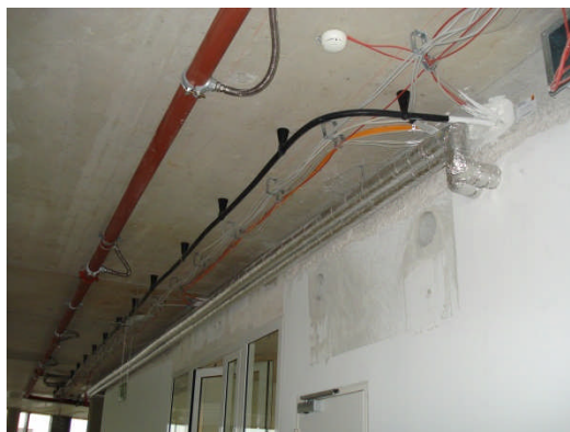
Beispiel einer Leckkabelschleife im Rohbau.

Bei Verlegung von Leckkabeln bzw. Schlitzbandkabeln innerhalb des Objektes ist dieses grundsätzlich als Schleife auszubilden, um im Unterbrechungsfall, zum Beispiel durch Brandeinwirkung oder mechanische Einwirkung, genügend Feldstärke vor Ort sicherzustellen. Alternativ ist eine zweiseitige Einspeisung zulässig. Die