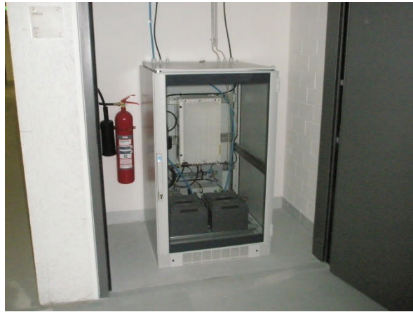
Remote Unit (TMO Repeater) und unabhängige Stromversorgung.

Objekte mit einer TMO-Objektfunkversorgung müssen inkl. der Geschosse die unterhalb der Erdgleiche liegen (Keller, Tiefgarage, Technikräume usw.) mit einem Signalpegel von mindestens -88 dBm versorgt werden. Der Versorgungsgrad ist durch eine Messung nachzuweisen.