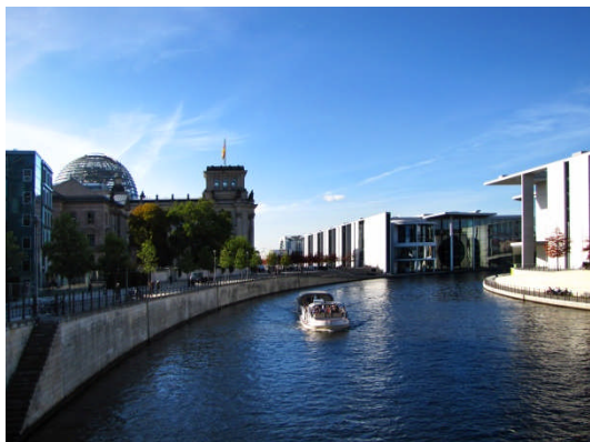
Das Unterirdische Erschließungssystem des Reichstags (links) sowie der Bundestagsverwaltung (rechts) besitzen eine eigene Basisstation als TETRA BOS-Objektfunkversorgung.

Sowohl geänderte baurechtliche Vorgaben, die zunehmende Verwendung moderner Funkwellen absorbierender Baustoffe (zum Beispiel Metallkonstruktionen, Stahlbeton, metallbedampfte Glasscheiben und ähnliches), als auch veränderte Bauweisen (zum Beispiel mehrere Tiefgeschosse, innenliegende Treppenträume usw.) führen zu starken Einschränkungen im Funkverkehr der Einsatzkräfte der BOS.